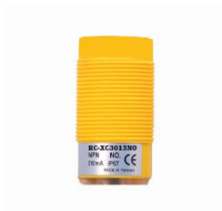
型號 : RC-XC3015